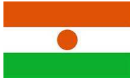
Commune Rurale d'In Gall (Niger)