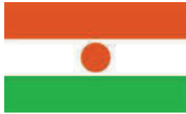
Commune Rurale d'In Gall (Niger)